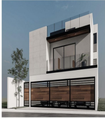
CONSTRUCCION: 347 M2 TERRENO: 288 M2