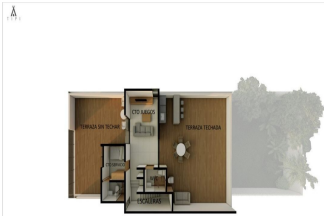
ASPECTO 483 M2