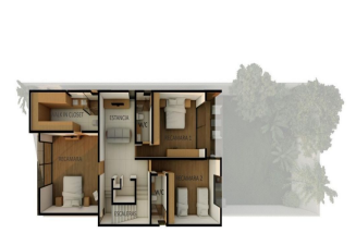
PLANTA ALTA 145 M2