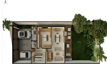
PLANTA BAJA 348 M2