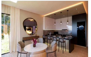
Cocina con diseño abierto Open design kitchen