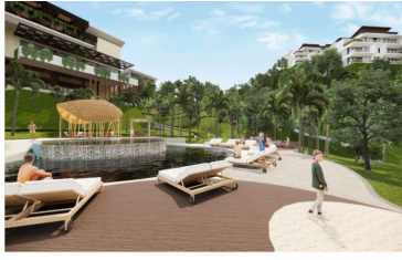
Club de playa Beach club