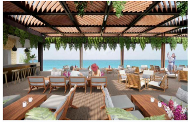
Terraza con semi sombra y vista al mar Ocean view semi shaded terrace