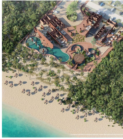
Vista area de amenities Aerial view Amenities